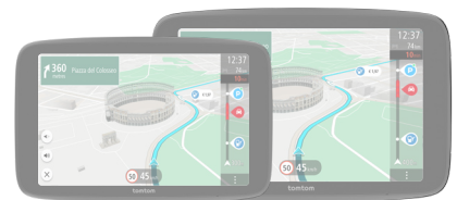
TomTom GO Superior